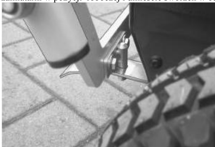
prawa strona dolnej części uchwytu

Blokada uchwytu ze sworzniem jest zmontowana i skręcona śrubą. Zamontować blokadę uchwytu ze sworzniem jak pokazano na rysunku. Dokręcić obydwie śruby, ustawić uchwyt zmiatarki w pozycji roboczej i umieścić sworzeń w otworze blokady.